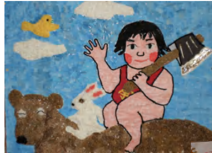
(クマに乗った金太郎さん)