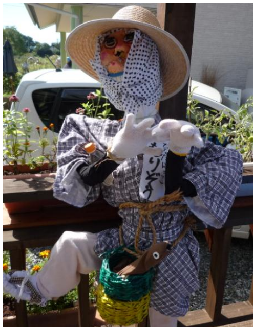
案山子の「もりそう」